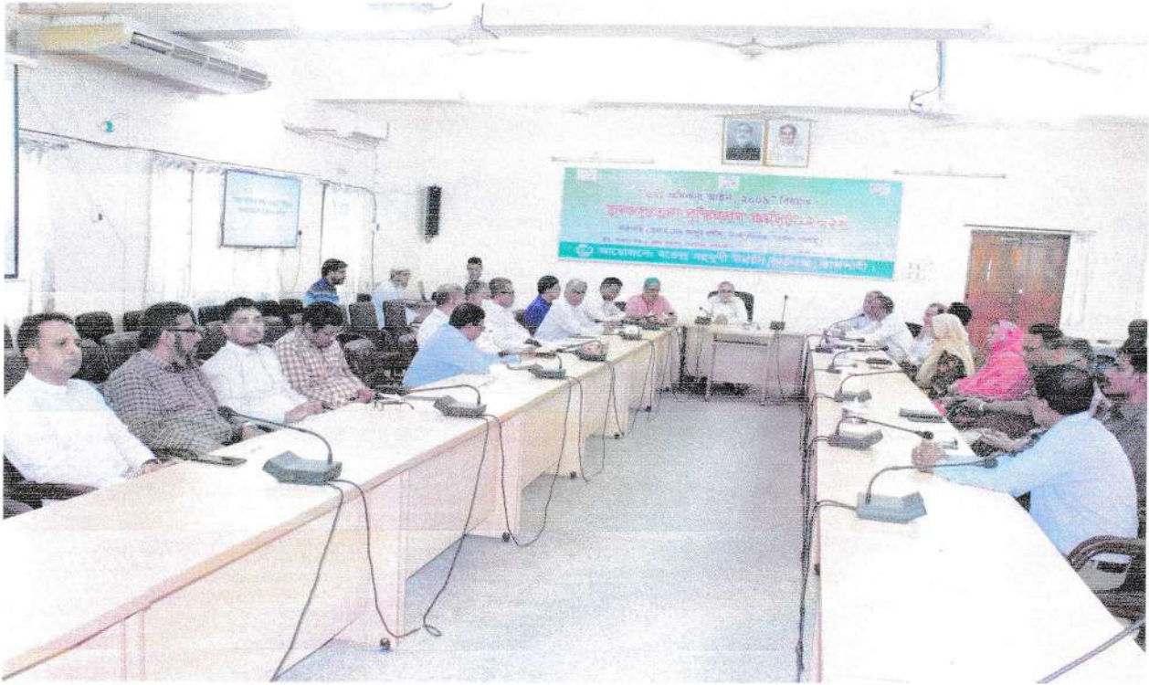
বিএমডিএ- কর্মসম্পাদন সূচক-২.৩.১